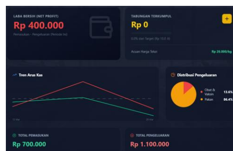
Gambar 6. Tampilan output rekapitulasi keuangan peternak

Gambar 6 memperlihatkan bahwa SI-Gayatri tidak hanya berfungsi sebagai media pencatatan produksi, tetapi juga mendukung pencatatan keuangan usaha. Pemisahan antara pemasukan dan pengeluaran membantu peternak mengetahui arus kas secara lebih jelas. Selain itu, perhitungan otomatis terhadap selisih pemasukan dan pengeluaran memudahkan peternak dalam mengevaluasi kondisi keuangan usaha pada periode tertentu. Dengan adanya fitur ini, data produksi dan data keuangan dapat digunakan secara bersama-sama sebagai dasar evaluasi usaha peternakan.