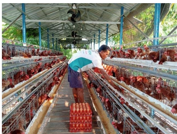
Gambar 1. Peternak ayam petelur Desa Kacangan [1]

Desa Kacangan di Kecamatan Tambakrejo, Kabupaten Bojonegoro merupakan wilayah yang memiliki potensi pengembangan ekonomi masyarakat berbasis peternakan, khususnya ayam petelur. Keberadaan Kelompok Peternak Kacangan (KPK) yang mulai merintis usaha sejak 2018 menunjukkan perkembangan yang cukup pesat, terutama setelah adanya dukungan hibah dari pemerintah provinsi yang meningkatkan skala usaha peternak dari puluhan menjadi ratusan ekor ayam per kandang [1]. Kondisi ini menunjukkan usaha peternakan ayam petelur memiliki prospek yang menjanjikan untuk dikembangkan sebagai sumber pendapatan masyarakat. Kegiatan peternak ayam Desa Kacangan dapat dilihat pada Gambar 1.