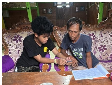
Gambar 7. Pendampingan anggota Kelompok Peternak Kacangan

Gambar 7 menunjukkan salah satu proses pendampingan anggota Kelompok Peternak Kacangan dalam penggunaan SI-Gayatri. Kegiatan pendampingan dilakukan secara langsung agar peternak dapat memahami alur penggunaan sistem melalui praktik, bukan hanya melalui penjelasan teoritis. Pendekatan ini menjadi bagian penting dalam proses adopsi teknologi karena dapat membantu mengurangi hambatan literasi digital, meningkatkan kepercayaan pengguna, serta mendorong peternak untuk beralih secara bertahap dari pencatatan manual ke pencatatan digital.