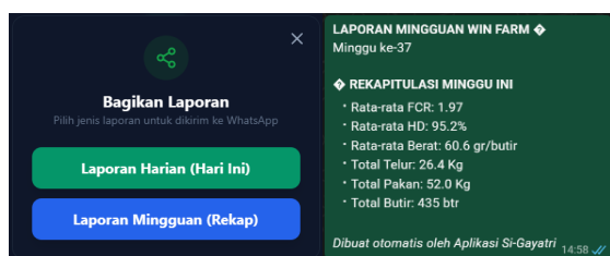
Gambar 4. Fitur pelaporan otomatis melalui WhatsApp

Pengembangan sistem dilakukan secara iteratif melalui uji coba langsung bersama peternak. Setiap kendala penggunaan dan kebutuhan tambahan yang muncul selama implementasi digunakan sebagai dasar perbaikan sistem sehingga aplikasi yang dihasilkan lebih adaptif terhadap kondisi lapangan dan kemampuan pengguna. Implementasi sistem menghasilkan keluaran data terstruktur yang selanjutnya menjadi dasar dalam proses monitoring dan evaluasi usaha peternakan.