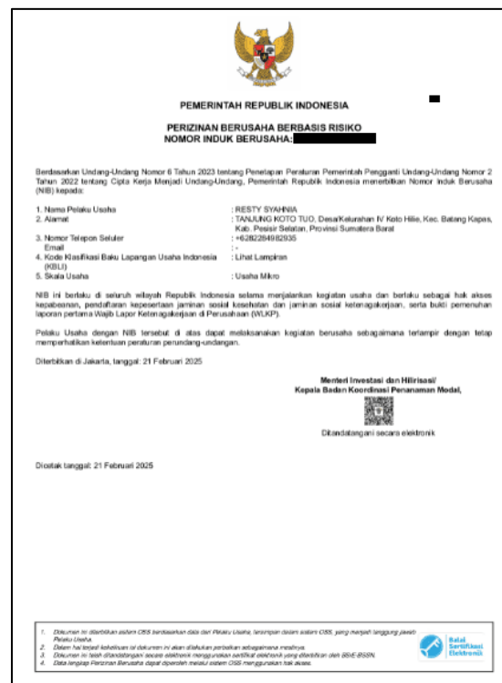
Gambar 3 NIB Resty Catering & Cake

Setelah seluruh tahapan pendaftaran selesai dilakukan, sistem OSS menerbitkan NIB sebagai bukti legalitas usaha yang dimiliki oleh mitra. Bukti penerbitan NIB tersebut ditunjukkan pada gambar 3.