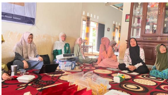
Gambar 4 Dokumentasi Kegiatan Pendampingan

Kontribusi penting lainnya dari kegiatan ini terlihat melalui pemanfaatan sistem OSS dalam meningkatkan akses UMKM terhadap layanan perizinan usaha, khususnya di wilayah yang memiliki keterbatasan akses terhadap layanan administrasi. UMKM mitra berada di Nagari Koto Tuo, Kecamatan Batang Kapas, yang lokasinya relatif jauh dari pusat layanan administrasi pemerintahan di wilayah tersebut. Dalam kondisi seperti ini, sistem perizinan digital seperti OSS memberikan berbagai kemudahan. Proses pendaftaran usaha dapat dilakukan secara daring sehingga pemilik usaha tidak perlu berulang kali datang ke kantor pemerintahan. Dengan demikian sistem perizinan digital ini mampu meningkatkan aksesibilitas serta efisiensi layanan administrasi bagi UMKM secara signifikan [6], [13], [16]. Temuan ini menunjukkan bahwa pemanfaatan layanan perizinan digital memiliki potensi besar dalam memperluas akses legalitas usaha bagi UMKM yang berada di wilayah pedesaan atau daerah yang memiliki keterbatasan akses terhadap layanan administrasi pemerintah. Gambar 4 memperlihatkan proses kegiatan pendampingan yang dilakukan oleh tim pengabdian.