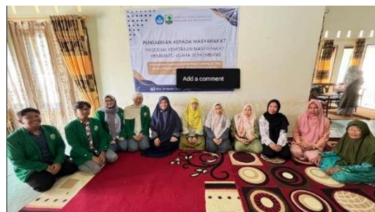
Gambar 5 Tim Pengabdian Masyarakat Memberikan Bantuan Kepada Mitra UMKM.

Hasil kegiatan ini menunjukkan bahwa pendampingan memiliki peran yang sangat penting sebagai penghubung antara layanan digital pemerintah dengan kesiapan pelaku UMKM dalam memanfaatkan sistem tersebut. Melalui pendampingan secara langsung, UMKM mitra dapat memahami tahapan proses pendaftaran usaha dan berhasil memperoleh NIB. Temuan serupa juga dilaporkan dalam berbagai program pengabdian kepada masyarakat sebelumnya yang menunjukkan bahwa kegiatan pendampingan secara signifikan mampu meningkatkan kapasitas UMKM dalam memahami prosedur administrasi serta mendorong formalitas usaha kecil [4], [7], [8]. Oleh karena itu, program pendampingan dalam legalisasi usaha dapat memainkan peran penting dalam mendukung pengembangan UMKM yang berkelanjutan, khususnya di wilayah pedesaan yang memiliki keterbatasan akses terhadap layanan perizinan. Pendampingan semacam ini juga dapat menjadi model pendekatan yang efektif dalam mempercepat proses formalisasi usaha bagi UMKM di berbagai daerah. Dokumentasi kegiatan tim pengabdian bersama mitra ditunjukkan pada gambar 5.