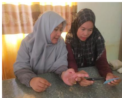
Gambar 2 Pendampingan Melengkapi Data Proses Registrasi OSS

Melalui proses pendampingan tersebut, UMKM mitra berhasil menyelesaikan prosedur pendaftaran dan memperoleh NIB sebagai bukti resmi legalitas usaha. Penerbitan NIB tidak hanya menjadi pencapaian penting bagi UMKM, tetapi juga memberikan pengakuan formal terhadap usaha tersebut sebagai entitas ekonomi yang terdaftar. Kepemilikan NIB juga memperluas akses UMKM terhadap berbagai program pemerintah, layanan keuangan, serta berbagai inisiatif pengembangan usaha bagi UMKM [6], [13], [14]. Kepemilikan legalitas usaha dapat secara signifikan meningkatkan kredibilitas UMKM serta memperluas akses terhadap jaringan ekonomi formal [15], [16]. Perubahan kapasitas mitra sebelum dan sesudah kegiatan pendampingan disajikan pada Tabel 2.