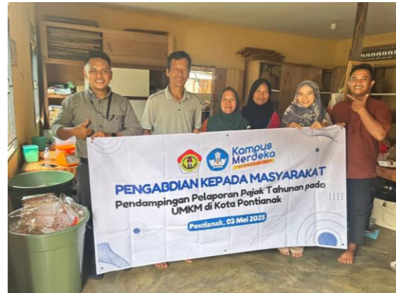
Gambar 2. Proses Pendampingan Pelaporan Pajak Tahunan

dilakukan selama 2 (dua) periode tahun pajak yaitu tahun 2023 dan 2024 dikarenakan pemilik usaha terakhir kali melaporkan kewajibannya pada tahun 2022. Tim pengabdian mendampingi pemilik UMKM untuk mengunduh e-form pelaporan pajak pada situs djp online pemilik UMKM dan mendampingi proses pengisian SPT 1770 WP OP tahunan berbasis e-form.