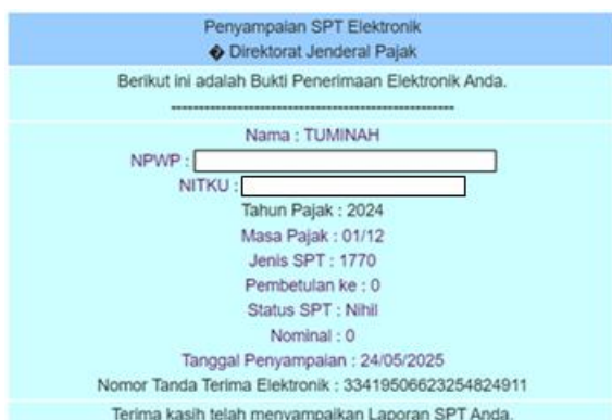
Gambar 4. Bukti Pelaporan SPT Tahunan Stick Talas Mbak Tum

Setelah semua tahapan proses pelaporan pajak UMKM berlangsung, tim pengabdian tetap melakukan evaluasi, pendampingan dan memberikan jasa konsultasi terkait bidang perpajakan kepada pemilik UMKM untuk tahun 2025 yaitu dengan memonitoring pencatatan peredaran bruto/omzet perbulan guna pelaporan pajak tahun depan.