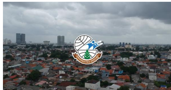
Gambar 2. Hasil Video

3.2 Arsitektur dan Fitur Sistem yang Dikembangkan Sistem yang berhasil dikembangkan memiliki arsitektur three-tier yang terdiri dari presentation layer, application layer, dan data layer. Presentation layer mencakup jaringan display di lingkungan kampus dan panel administrasi berbasis web yang dapat diakses melalui browser dari perangkat apa pun. Application layer berisi logika bisnis sistem yang mengelola autentikasi pengguna, penjadwalan konten, distribusi konten ke display, dan monitoring status display. Data layer terdiri dari database konten yang menyimpan metadata konten beserta file video dan gambar yang dioptimalkan untuk streaming [22].