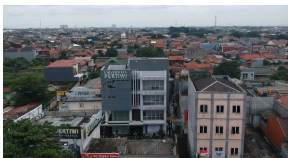
Gambar 3. Hasil Uji Konten Video

Produksi konten video digital merupakan salah satu aspek paling kritis dalam keberhasilan sistem ini. Tim peneliti menyadari bahwa sistem yang paling canggih secara teknis pun tidak akan efektif jika konten yang ditampilkan tidak menarik dan relevan. Oleh karena itu, pendekatan yang diadopsi dalam produksi konten adalah human-centered content design , di mana kebutuhan dan preferensi pengguna akhir menjadi panduan utama keputusan kreatif.